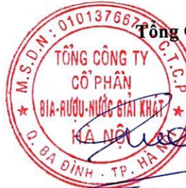
Ngô Quế Lâm