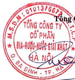
Ngô Quế Lâm